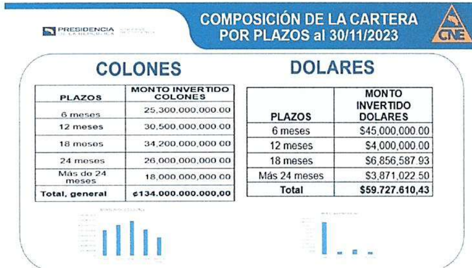
CNE: Cartera de Inversiones al 30 de noviembre de 2023 (Composición por tipo de moneda)